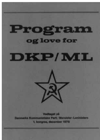
Forside på DKP/ML's program og love, vedtaget på den første - og stiftende - kongres 1978

angreb på Vietnam i en militær afstrafningsekspedition.