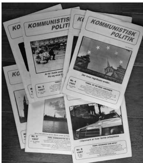
Kommunistisk Politik, flere numre fra første årgang, 1967

Derfor er afklaring, ideologisk og politisk afklaring, og præcisering af politik og positioner nødvendig. Drømmen om samling af hele den kommunistiske bevægelse i én organisation uden en sådan forudgående afklaring af linje og program, af strategi og taktik, i en verden, hvor imperialismen og reaktionen er i offensiven, er værdiløs og sentimental. Et stærkt kommunistisk parti skabes ikke ved at glatte de politiske modsætninger ud, når disse er af principiel og linjemæssig karakter.