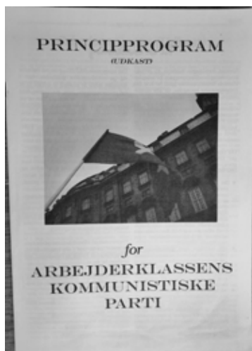
Forside på Principprogram for Arbejderklassens Kommunistiske Parti (Udkast), 2000

I programerklæringen ‘Den Kommunistiske Internationales retningslinjer’ (1919) hed det om vejen til socialismen (arbejderklassens magterobring):